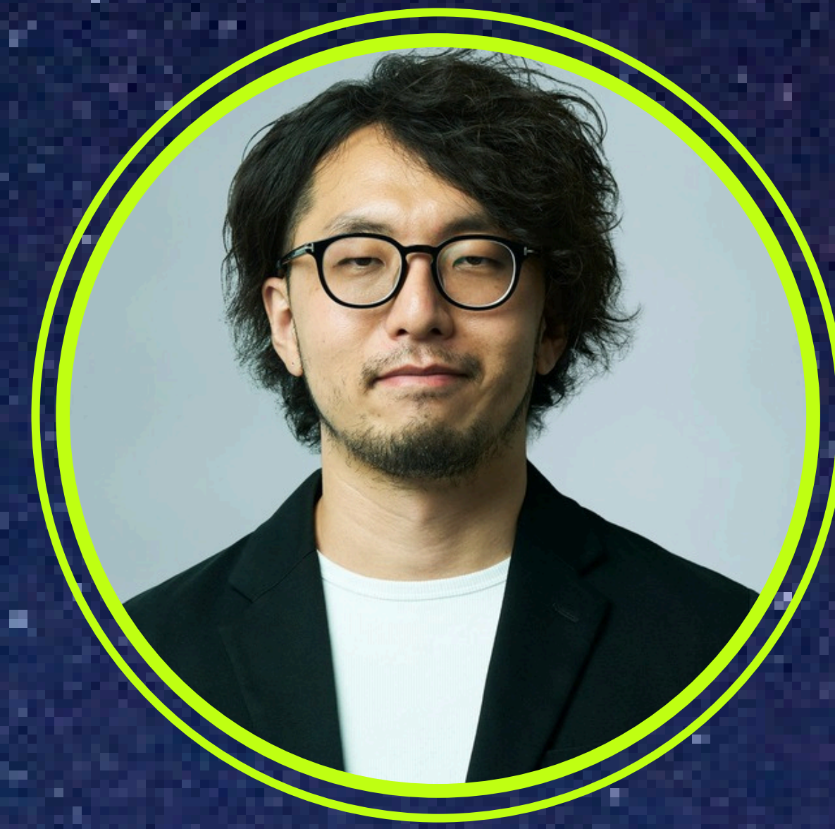
株式会社スペースシフト CTO（最高技術責任者）