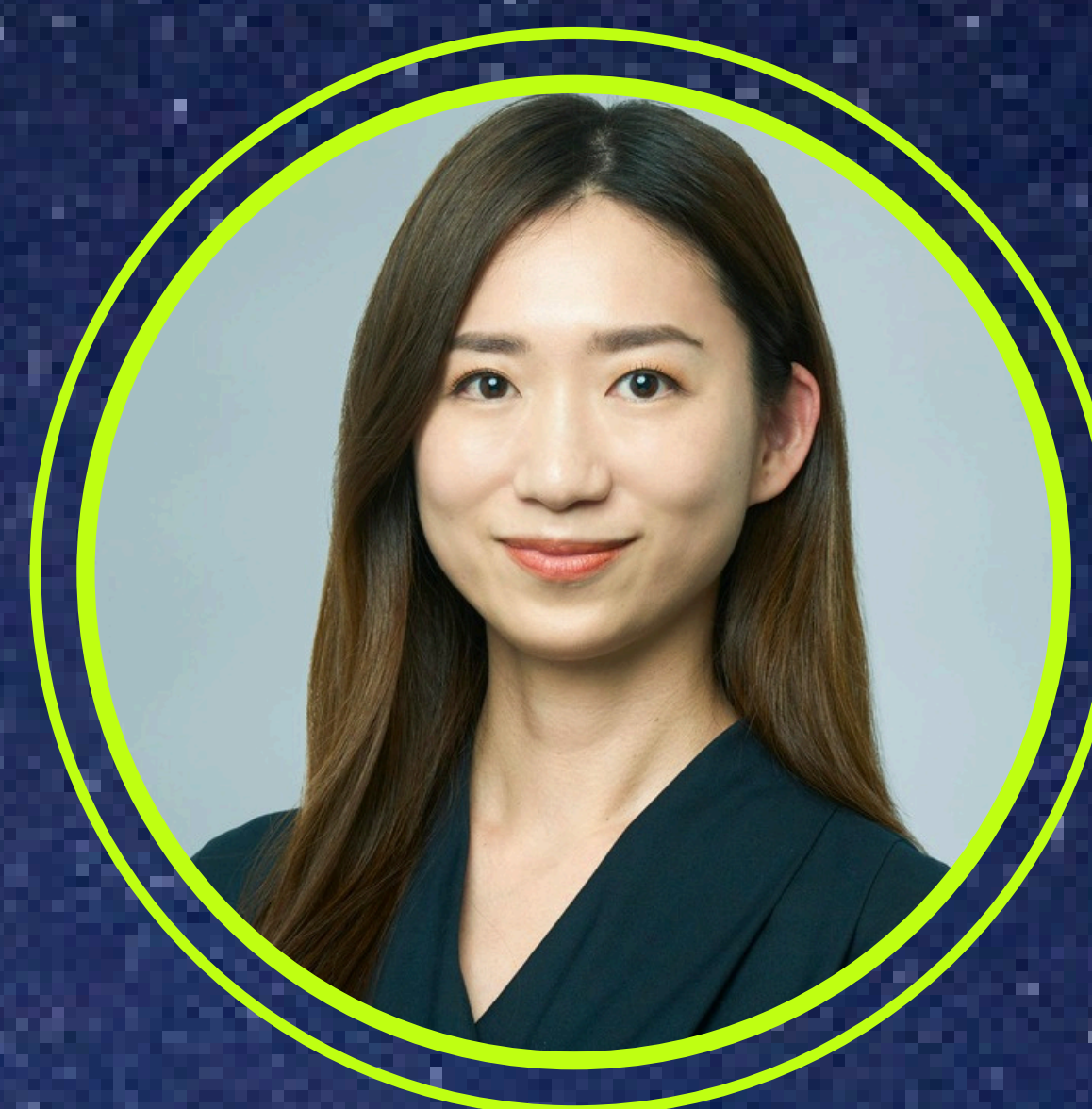
株式会社スペースシフト CBO（最高事業責任者）

株式会社スペースシフトより講師を招き、ナイジェリアにおける事例をはじめとして、先進的な実証事業を展開する中で得られた、最新技術（衛星データ・フィンテック）の現場実装における可能性や課題について議論します。